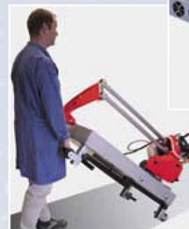
ALUMA met wielen voor een gemakkelijk transport.