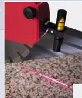
ALUMA met laser zaaglijn-projectie.

Constructie- en maatwijzigingen voorbehouden.